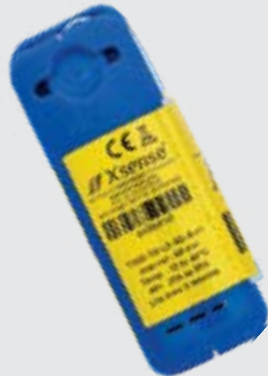
Sensor de radiofrecuencia