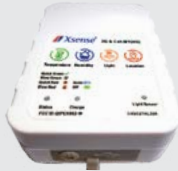
Real Time 4G