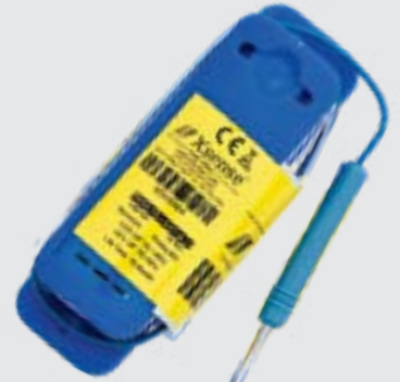
Sistema de monitoreo en packing