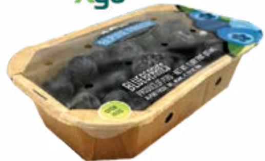
Lidding film resellable